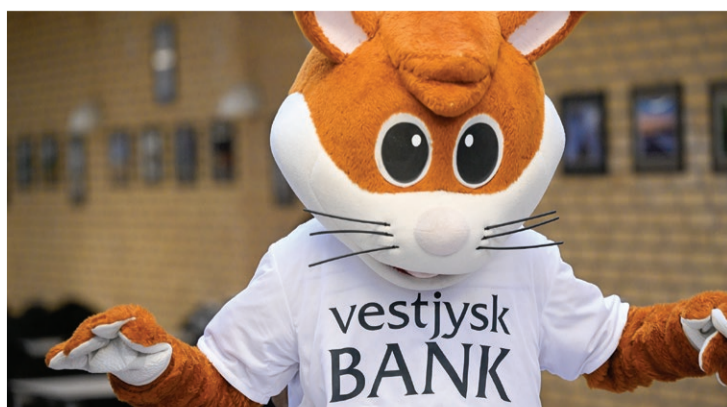
15 års jubilæum med ny aftale .... 08