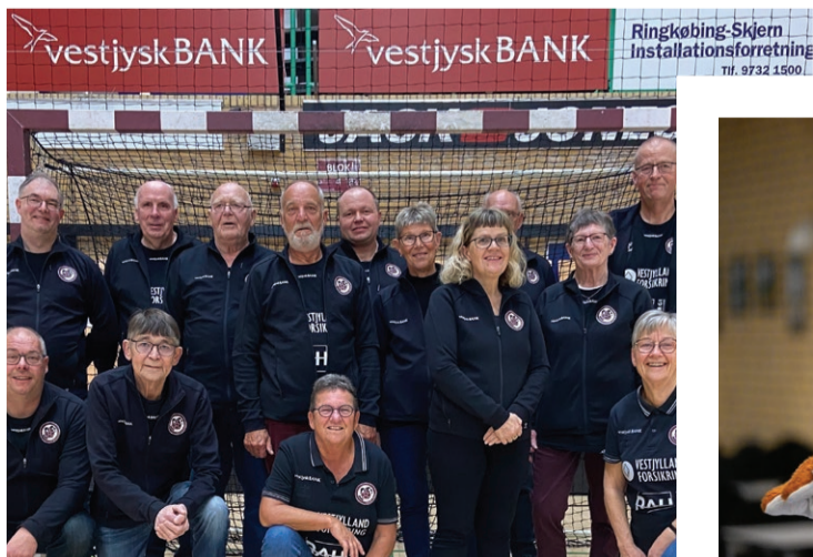
En ordentlig håndfuld passion & frivillighed ..... 06