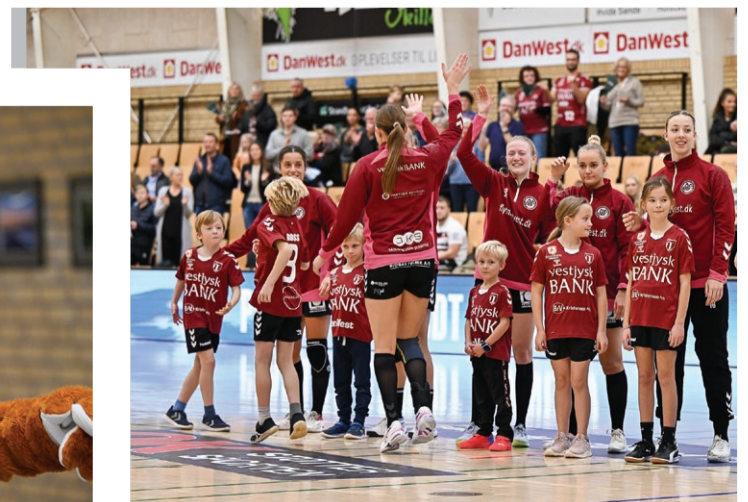
Klub Eksilvestjyder og FLYTMOD VEST ..... 12